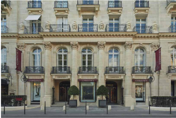
Le siège de Christie's France, avenue Matignon.

Chaque fin d'année, les maisons de ventes françaises publient leurs résultats. Grâce à quelques enchères millionnaires surprises ou pas, ou à une grosse collection, le bilan peut être flatteur. Mais il ne s'agit que de la partie émergée de l'iceberg : il ne détaille que le volume des vacations. Une étude confidentielle et payante de 374 pages publiée cette année par la société d'analyse économique Plimsoll s'est penchée sur les vrais chiffres de ces sociétés, à savoir leur situation financière et leur rentabilité. Pour ce faire, elle a analysé leurs bilans de l'année 2018 déposés auprès des greffes des tribunaux de commerce. Et le fruit de cette étude est pour le moins surprenant.