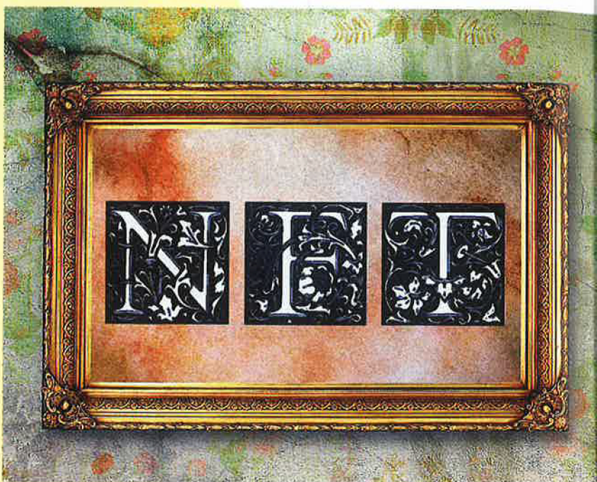
▲ Les œuvres NFT ne s'affichent pas dans les musées. Elles sont consultables en ligne uniquement.